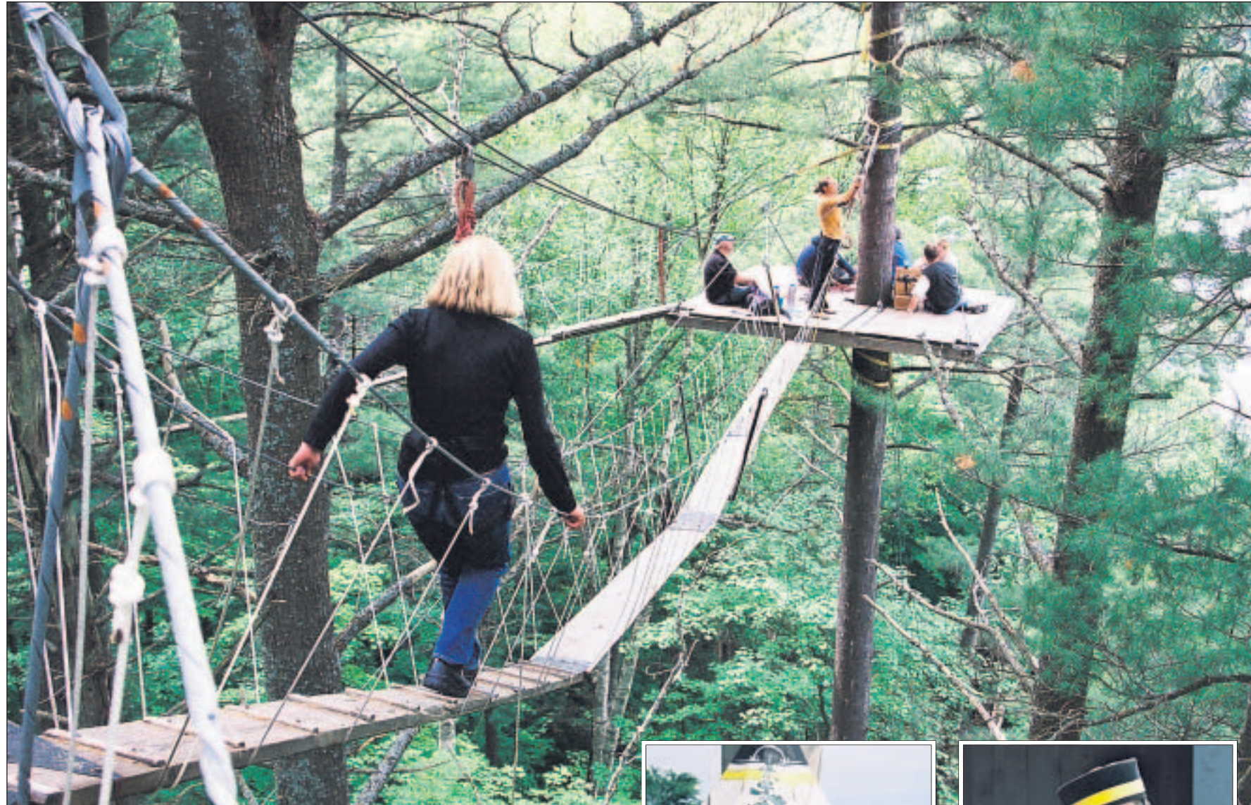
Picknick in den Wipfeln der Bäume: Der „Walk in the Clouds“ im Haliburton Forest und Wildlife Reserve ( www.haliburtonforest.com ).

Schleifenbaum nutzt und vermarktet alle Möglichkeiten, die sein Wald bietet, ohne diesen seiner Natürlichkeit zu berauben. Der Haliburton Forest war der erste in Kanada mit einer FSC-Zertifizierung für nachhaltige Bewirtschaftung. 22 Baumarten sind dort heimisch, mehr als doppelt so viele wie in sächsischen Wäldern. Ahorn und Buche dominieren, sie sorgen im Herbst für den farbenprächtigen Indian Summer. Schwindel-