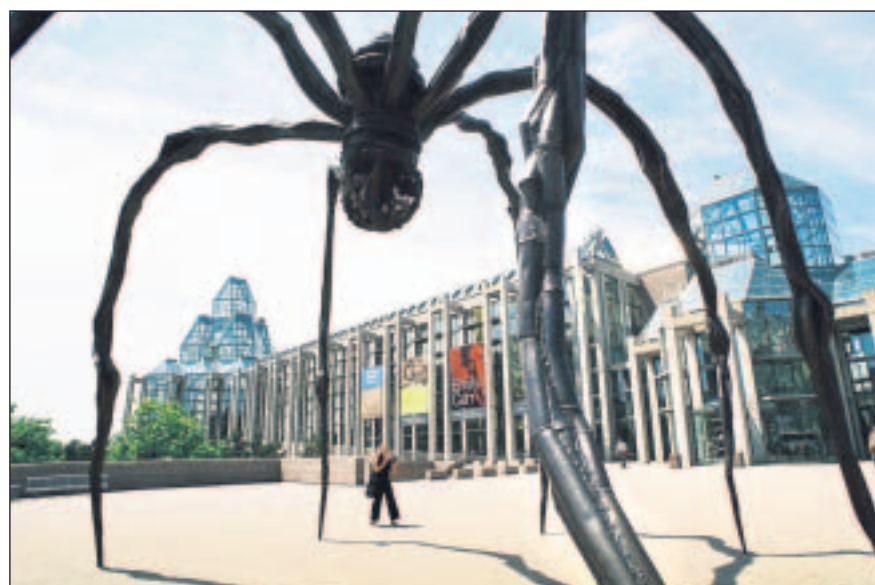
Die Spinne „Maman“ von Louise Bourgeois bewacht die architektonisch bemerkenswerte und mit erlesenen Kunstwerken ausgestattete Nationalgalerie in Kanadas Hauptstadt.

freie können die Laubfärbung, oder auch die Blüte der Kiefern, hautnah in den Wipfeln der Bäume beobachten. Der 1997 angelegte 500 Meter lange „Walk in the Clouds“ führt auf nur 20 Zentimeter breiten Brettern 20 bis 30 Meter über dem Waldboden durch das Geäst.