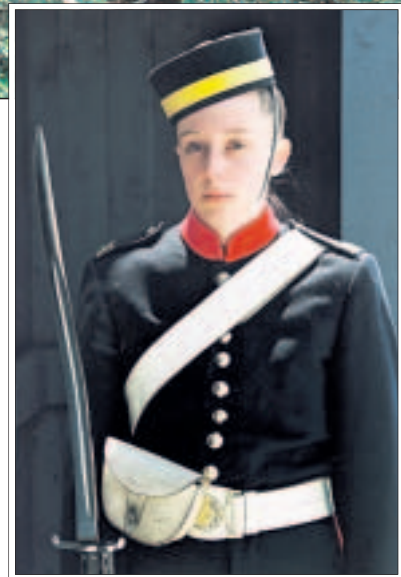
Geschichte aus Sicht der Eroberer: Freizeit-Soldatin in Fort Henry, Kingston.

Die kanadische Provinz Ontario, dreimal so groß wie Deutschland, ist ein Paradies für Naturliebhaber. „Glitzerndes Wasser“ nannten die Irokesen ihr Land. Ontario, dessen Fläche zu einem Sechstel aus Seen und Flüssen besteht, grenzt im Süden an die Großen Seen und im Norden an die Hudson Bay. Die Provinz zählt kaum zwölf Millionen Einwohner, die vor allem im klimatisch gemäßigten Süden siedeln. Mehr als die Hälfte lebt in den Großstädten Toronto und Ottawa, der Hauptstadt Kanadas. Dazwischen liegen beschauliche Städtchen und malerische Landschaften, etwa die „Thousand Islands“ bei Kingston. Die über 1800 Inseln, die kleinsten messen kaum zwanzig Quadratmeter, lassen sich am besten mit einem Kajak erkunden, als geführte Tagestour für 125 Dollar – oder, ähnlich im