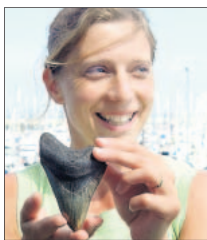
Begehrte Funde: auf der Suche nach versteinerten Haifischzähnen

Gebeugt gehen sie am Strand entlang. Ihre Augen sind wachsam auf den Boden gerichtet. Väter hocken mit ihren Kindern im Kreis und schütten Sand durch feine Gittersiebe. Sie alle sind auf der Suche nach dem „Schwarzen Gold“ von Cadzand, den Haifischzähnen. Sie sind die größte Attraktion von Seeländisch-Flandern, der Region tief im Süden der Niederlande. Das grüne Bauernland mit kleinen Dörfchen ist eine beliebte Ferienregion – auch wegen des elf Kilometer langen Strandes zwischen Cadzand und Breskens.