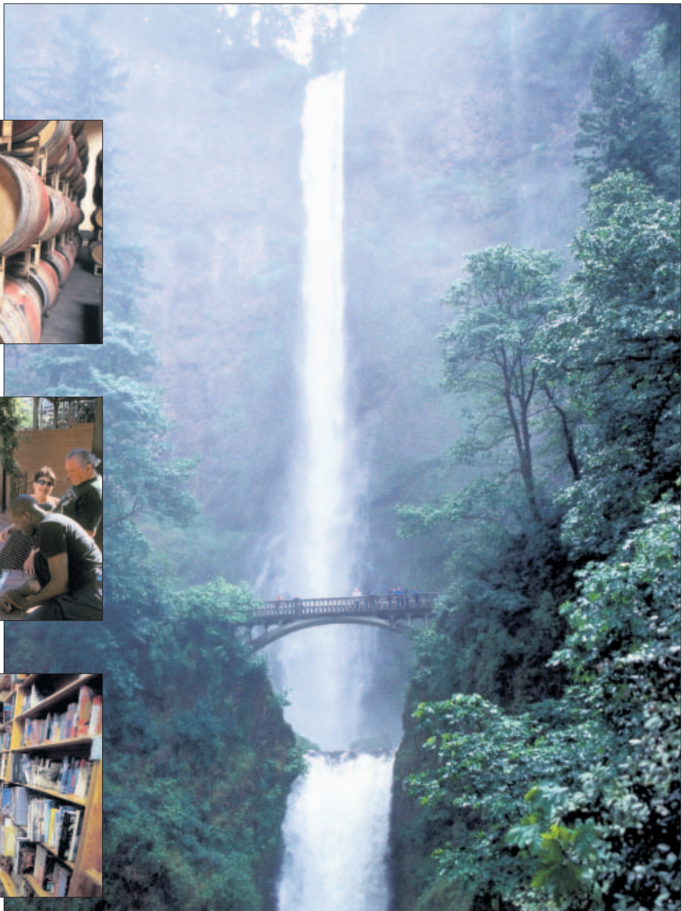
Aus 189 Meter Höhe stürzt das Wasser der Multnomah Falls in die Schlucht.

Die nette Idee ist aus dem Film „Die fabelhafte Welt der Amélie“ geklaut. Dieser Streifen ist französisch und nicht in Oregon gedreht. Wohl aber diente das beschauliche und dünn besiedelte Land als