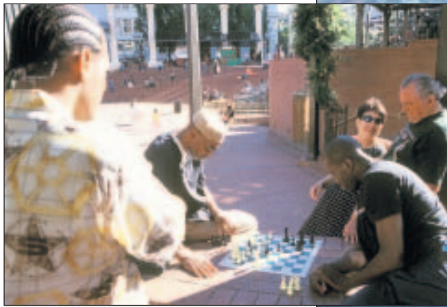
Freiluft-Schach auf dem Pioneer Courthouse Square in Portland/Oregon