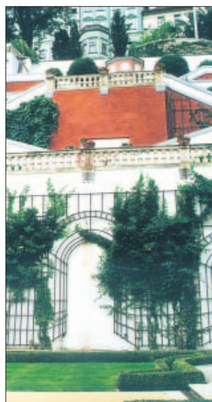
Am Hang: Blick auf die Gartenanlagen unterhalb der Prager Burg

Sportartikelherstellers Nike in Eugene mündete oder in Powell's Book in Portland, der größten Buchhandlung der Welt. Schon 1974 führte Oregon das Dosenpfand ein und hat vor zwei Jahren als bislang einziger US-Bundesstaat Sterbehilfe staatlich sanktioniert. Per Volkentscheid übrigens, wie alle wichtigen Gesetze in Oregon. Eines davon dürfte die deutsche Biertrinkernation interessieren: das Braurecht. Oregon ist das Land der so genannten Mikrobrauereien. Über 350 soll es geben, bei gerade mal 3,4 Millionen Einwohnern. Nur mit Pilsner geben sich die Brauer nicht ab. Der 1988 gegründete Rogue Ales Public House in Newport zum Beispiel hat 34 verschiedene Biersorten erfunden, 4,50 Dollar kostet ein Pint (0,65 Liter). Eines heißt Shakespeare Stout. Ob es beim Dichten hilft, ist nicht bekannt. Das Fischezählen jedenfalls wird damit zunächst zum Lustspiel. Aber die Tragödie ist unausweichlich. THOMAS MORGENROTH